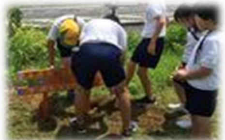
北泉公民館の花壇管理