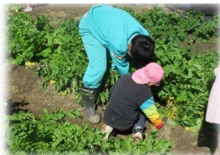
児玉保育園の収穫体験