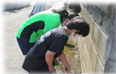
市内一斉清掃の様子