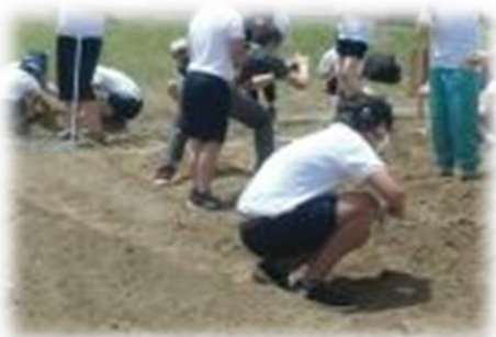
ひまわりの種まきの様子

「特別支援学校にはこんな素敵な子どもたちがいますよ。」という気持ちを込めて、地域に出て活動を行うことにより、学校運営協議会のご意見や保護者のご意見を学校運営に反映することが必要となります。まさに、地域と共に育っていける学校教育を目指した、コミュニティ・スクールの取組が動いているのです。皆様のご理解、ご協力をお願いいたします。