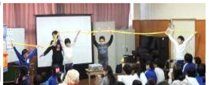
【右】児童4人がかりで計測した小腸の長さは、なんと6m!