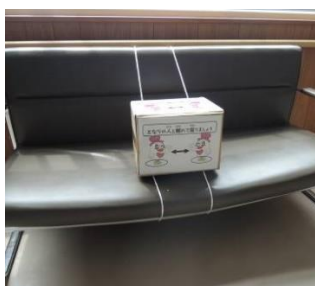
着席間隔の確保(ベンチ)