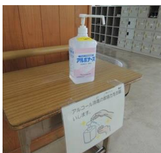
各所に手指消毒を設置

手洗いの励行や校舎施設及び教材の消毒はもちろん、全校を挙げて新型コロナウイルス感染防止対策を講じております。ここでは、紙面の都合により対策の一部を御紹介しますが、その他の対策については、本校ホームページに掲載しておりますので御覧ください。