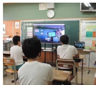
リモート授業(教室分散)