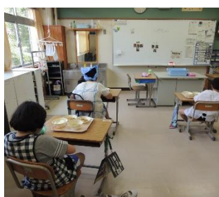
給食時の座席調整