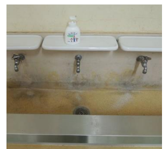
蛇口の制限(密接緩和)