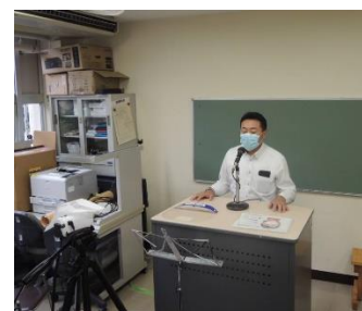
テレビ放送による全校集会