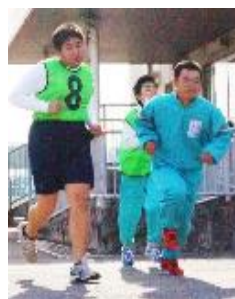
中学部マラソン大会の結果