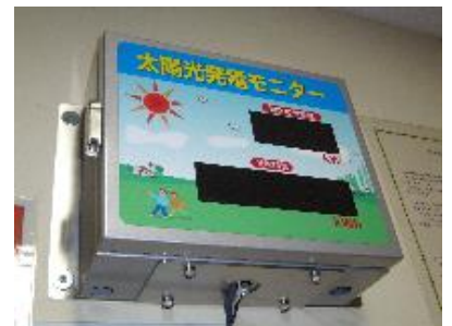
↑ 校舎屋上の太陽光発電設備 [上] ↓ 事務室壁面モニター [下]