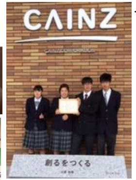
← 助成金贈呈式の様子